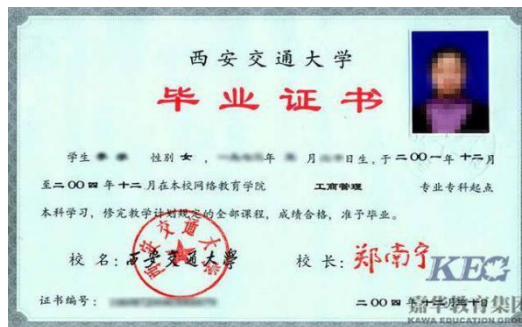
教育部学历证书电子注册备案表

八、往届毕业生须提供毕业证书照片和“中国高等教育学生信息网”的《教育部学历证书电子注册备案表》或《中国高等教育学历认证报告》，毕业证书丢失的提供毕业学校的相关证明材料。