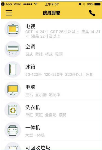
图 3 虎哥回收 APP

“虎哥回收”还依托互联网信息技术，对居民家庭实现了精准到户的生活垃圾分类信息登记，将每户家庭投放的生活垃圾重量和种类通过二维码扫入系统，量化统计分类行为和效果，真正引导居民做到分类投放。