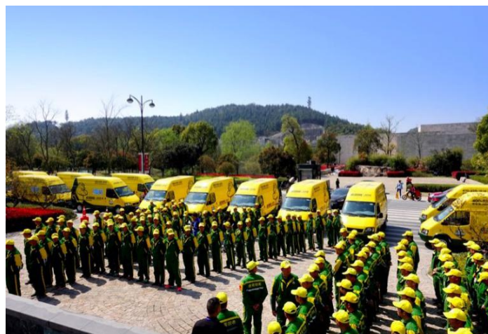
图 1 虎哥回收车队

2015 年下半年开始，杭州余杭区良渚街道的马路上多了许多辆黄绿相间的汽车，车身上一只长相憨厚的老虎摆出一副活力四射的样子，旁边写着“虎哥回收，一虎百应”。每天一大早开始，这些车辆穿梭在街道之间，等到傍晚，每辆车中都