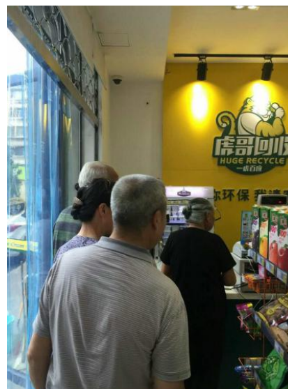
图4 虎哥回收环保金超市

杭州得益于支付宝已经成为全球最大的移动支付城市，市民们可凭一个手机走天下，享受购物、支付、交通等服务，现在“虎哥回收”向每户家庭发放专用垃圾袋，居民在专用垃圾袋满了通过相关互联网应用呼叫“虎哥回收”服务人员及时上门回收，服务人员按照垃圾重量支付给居民“环保金”，用于在线上的“虎哥商城”和线下“虎哥便利店”兑换商品，所购商品也是由“虎哥回收”服务站“虎哥”、“虎妹”免费配送上门。“虎哥商城”和“虎哥便利店”提供粮油米面、酒水饮料、家居日化等居民生活日常用品。